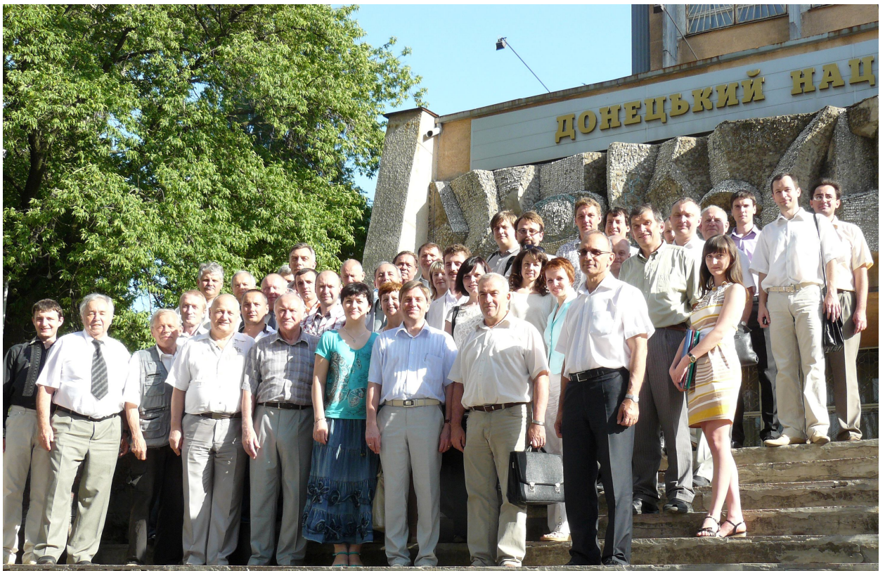
Участники VI международной научно-технической конференции «Управление режимами работы объектов электрических и электрохимических систем - 2013» (КРЕС - 2013)