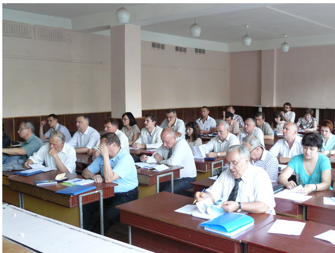
Работа секции «Электрические станции и системы»